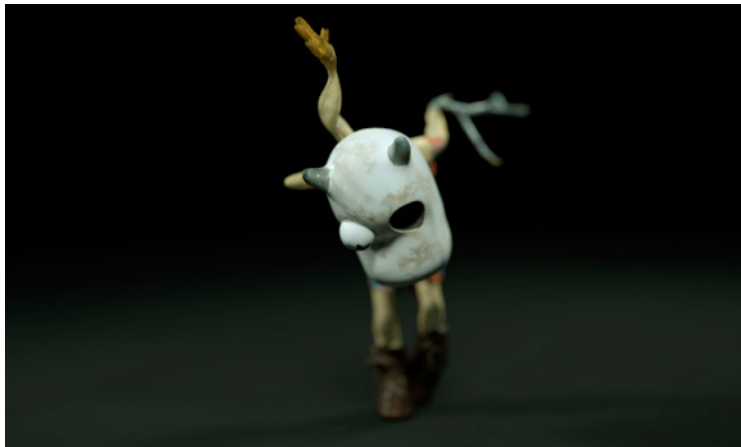
Mjöflickan/Milkmaid ur filmen med samma namn.